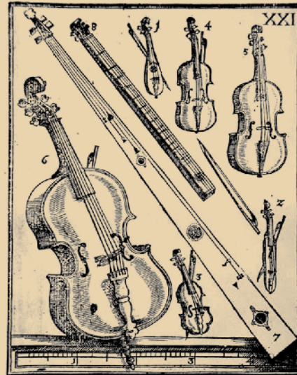
1. Kleine Violinen / Geigen ein Octava höher. 2. Dulciant-Geig ein Octave höher. 3. Höhere Dulciant-Geig. 4. Schrotzgeige. 5. Tenor-Geig. 6. Bass-Geig de braccio. 7. Zwißgeige.

Die Amatiwerkstatt in Cremona erreichte sehr früh eine Leitfunktion und erhielt sie über beinahe zwei Jahrhunderte.