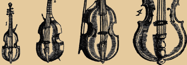
Viola da Gamba - im deutschen Gambe genannt

Im frühen 16. Jahrhundert wurden große szenische Stücke in Oberitalien aufgeführt. Während des Bühnenumbaus traten auch fahrende Musikanten auf. Diese Zwischenspiele waren so erfolgreich, dass manche Höfe Veranstaltungen ausschließlich mit Spielern organisierten. So erhielten die ersten Spielmannen eine feste Anstellung und soziale Anerkennung. Bis dahin waren nur Gamben als Streichinstrumente (mit Bündeln und ohne Randüberstand) in gesellschaftlich höheren Kreisen akzeptiert. Dieser Aufstieg der Geige wurde auch symbolisch mit einer anderen Bautechnik manifestiert: mit der Methode des Lautenbaus wird ein äußerlich formgleiches Instrument hergestellt. Wie die Gambe hatte die Laute einen hohen gesellschaftlichen Stellenwert. Im Handwerksrecht war das fixiert: die Verwendung einer Innenform und die Verbindung vom Hals mit dem Korpus durch einen Nagel durfte nur durch ausgebildete und in der Zunft organisierte Werkstätten erfolgen. Mit genau dieser Methode bauten die anerkannten italienischen Geigenbauer. So entstand in Oberitalien die Konzertvioline. Mit dieser Entwicklung erreichten die bundlosen Streichinstrumente und ihre Spieler Anerkennung; erst bei der Violine, später bei den größeren Instrumenten. Die Cellostimme wurde in Frankreich in vielen Orchestern noch im 19. Jhd. auf Gamben gespielt und streng genommen ist der Kontrabass bis heute ein Zwitterinstrument zwischen Gambe und Violine.