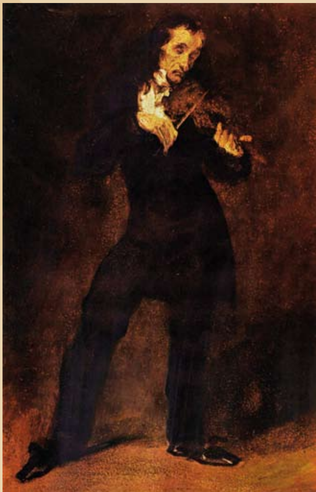
Niccolò Paganini von Eugène Ferdinand Victor Delacroix, 1832

Die endgültige Ablösung des Stainer/Amati Typs durch Stradivari oder Guarneri del Gesù als Leitbild im Geigenbau erfolgte während der Romantik: Paganini hatte seine Geige im Glücksspiel verloren und spielte notgedrungen auf einer geborgten Violine. Dieses Instrument von Guarneri del Gesù wurde ihm nach dem Konzert geschenkt. Auf dieser Violine – er nannte sie wegen ihres großen Tones „Kanone“ – konzertierte er bis an sein Lebensende. Erst danach wurde der eigentliche Wert der Geigen del Gesù's erkannt.